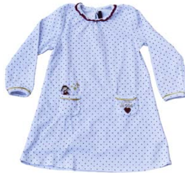
CHEMISE DE NUIT