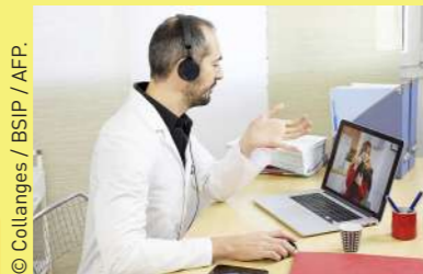
Beaucoup de médecins choisissent de communiquer avec leurs patients à distance, grâce à Internet. Cette méthode permet d'éviter les contacts.

Surveiller sa température 2 fois par jour