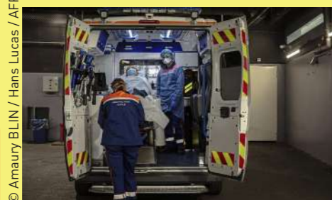
Dans les cas les plus graves de la maladie Covid-19, les malades sont transportés d'urgence à l'hôpital, par les équipes du SAMU.