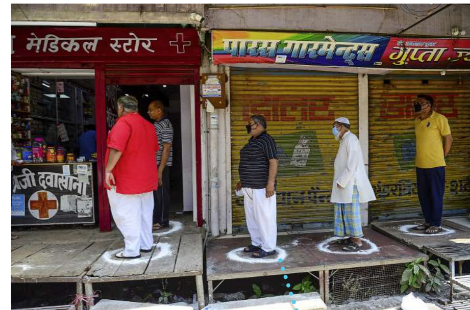
Ces Indiens font la queue devant une pharmacie.